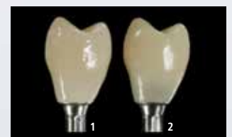
Hybrid-Abutment-Krone verklebt mit Multilink Hybrid Abutment HO 0 (1) und einem Befestigungsmaterial normaler Opazität (2)