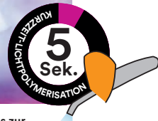
Kurzzeit-Lichtpolymerisation von Ketac Cem Plus zur leichten Überschussentfernung.