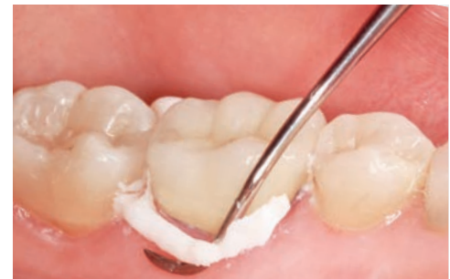
Leichtes Entfernen von überschüssigem Zement in wenigen Stücken.