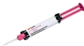
Ketac Cem Plus Automix