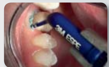
In-Vivo-Applikation von 3M™ ESPE™ Adstringierende Retraktionspaste.